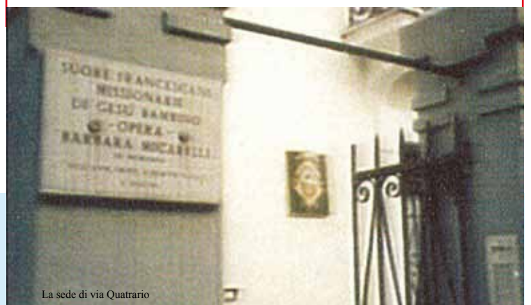
La sede di via Quatrario