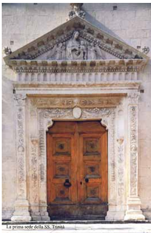
La prima sede della SS. Trinità

Sicuramente, per diventare una "frateria" importante e capace di poter affrontare una spesa