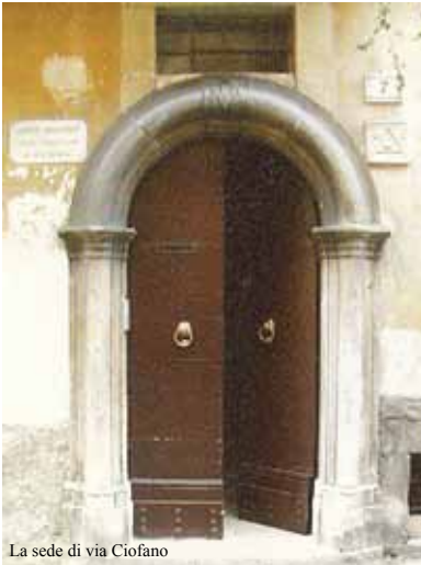
La sede di via Ciofano