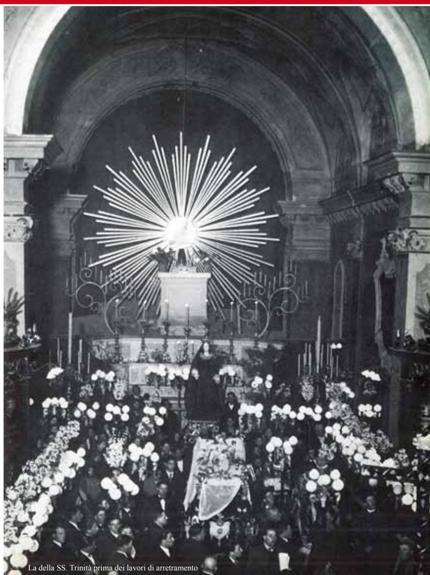
La della SS. Trinità prima dei lavori di arretramento

E' questo lo stigma delle antiche confraternite che, dopo le più importanti pratiche di devozione cristiana, dell'incremento del culto e di atti-